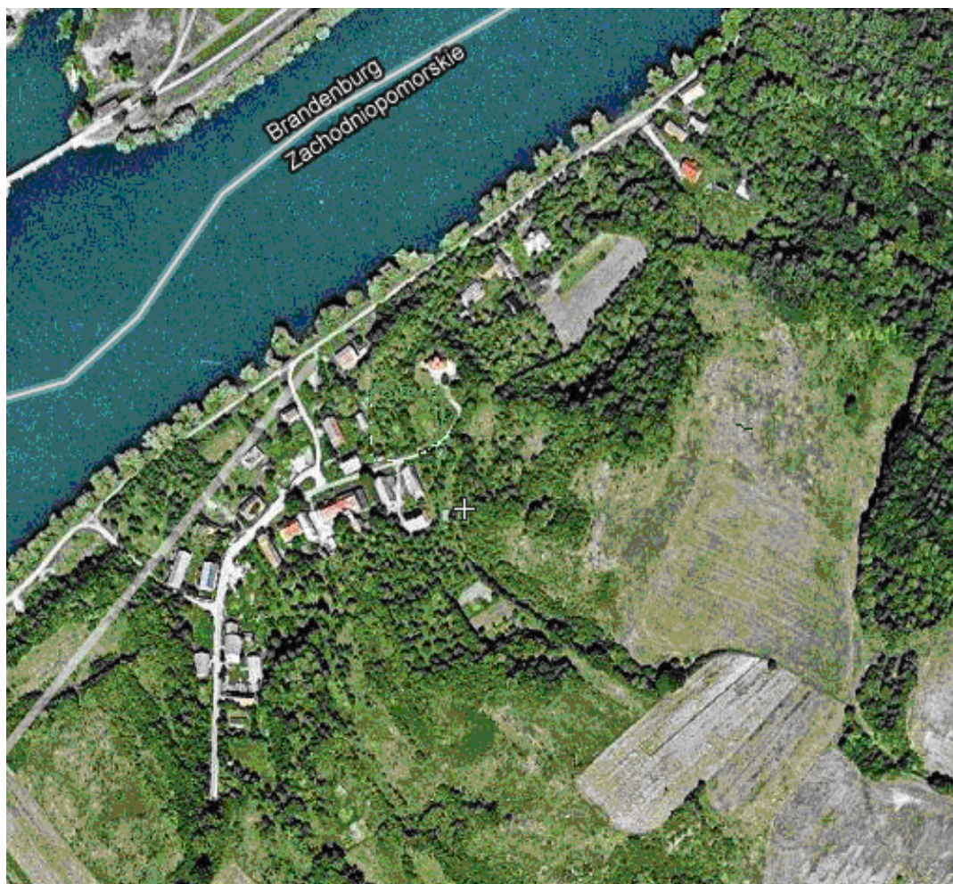
Mapa satelitarna miejscowości Zatoń Dolna