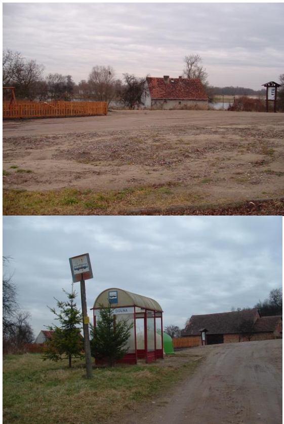
Centrum wsi Plac przy przystanku autobusowym

Przez wieś w kierunku Krajnika Dolnego nad samą Odrą ciągnie się droga, która wymaga oświetlenia.