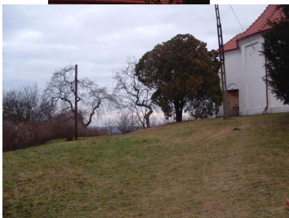
Wieża barokowego kościoła Teren wokół kościoła