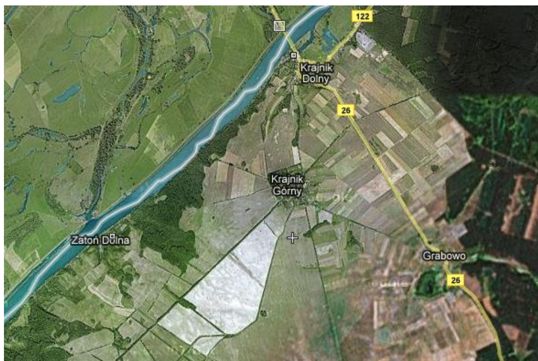
Mapa satelitarna Zatoń Dolna i najbliższe miejscowości