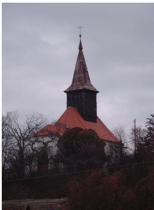
Kościół w Zatonii Dolnej

Kościół w Zatonii Dolnej pochodzi z 1711 r., barokowy, z cegły, na planie owalu, z przedsionkiem od zachodu. Z dachu wyrasta drewniana sygnaturka zbudowana w latach 1820-1830. Kościół prezentuje się bardzo malowniczo wśród zieleni w pagórkowatym terenie nadodrzańskim. Poświęcony 8.12.1977 r. przez bpa J. Strobę. Wpisany jest do rejestru zabytków pod nr rej. 398.