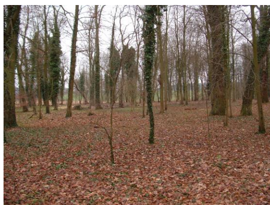
Park dworski – stan obecny