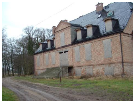
Dwór w Rurce- stan obecny