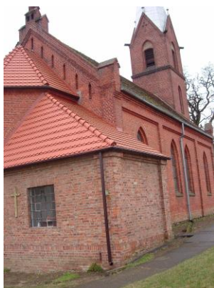
Kościół parafialny w Rurce

Kościół ewangelicki - parafialny (z filią w Strzelczynie); świątynia postawiona w 4 ćw. XIX w.; neogotycka ceglana budowla z wieżą i absydą. Wg danych z 1868 r. do parafii należało gospodarstwo z 216 morgami.