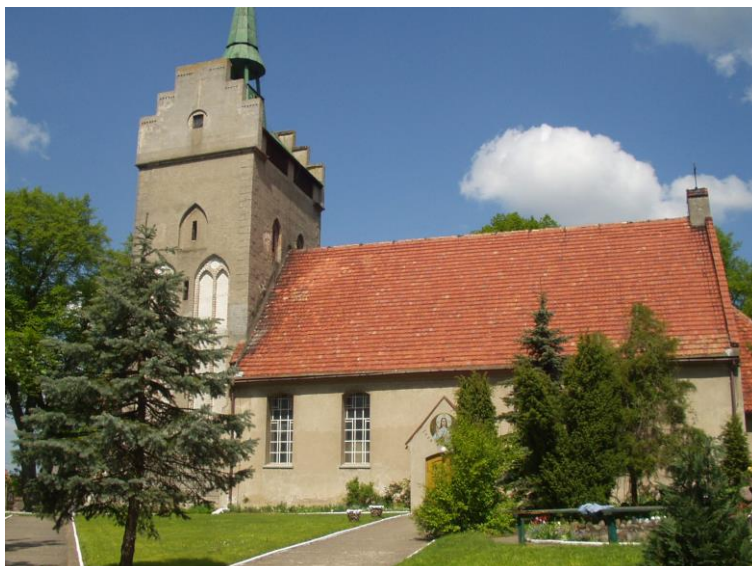
Rys. 2 Kościół z przełomu XIV/XV w.

Kaplica - gminy staroluterańskiej wzniesiona między 1816 a 1825 r.; obecnie pełni funkcję kaplicy pogrzebowej; obiekt zdewaloryzowany po remoncie w latach 90-tych XX w.