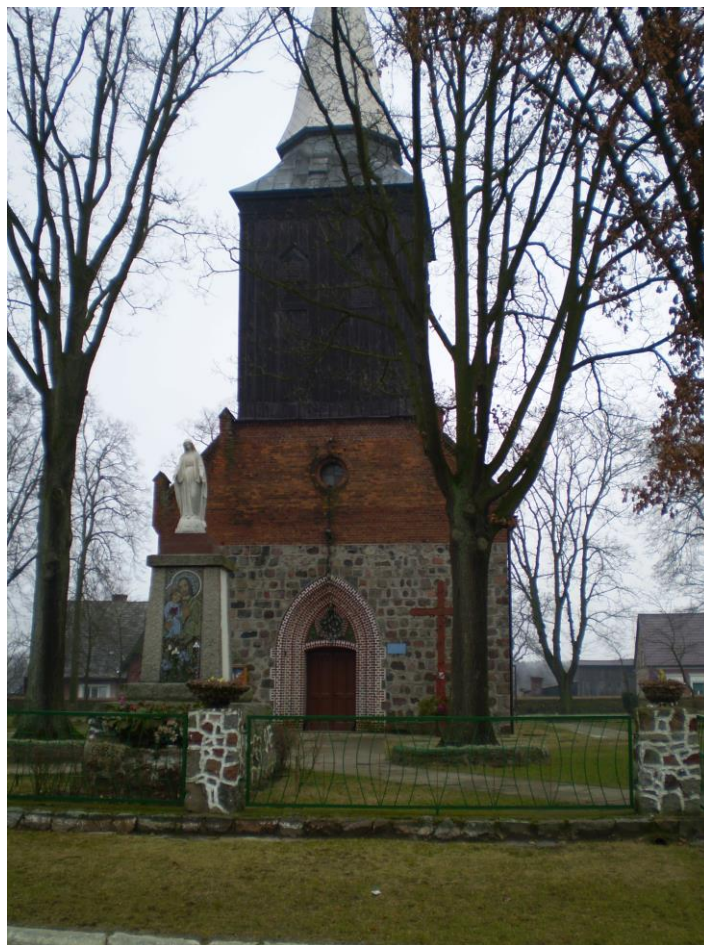
Kościół filialny w Lisim Polu

Szkoła - wzmiankowana w 1868 r., była prowadzona przez zakrystiana. Obecnie we wsi jest nowy budynek szkoły o architekturze odmiennej i niespójnej z zabudową wsi.