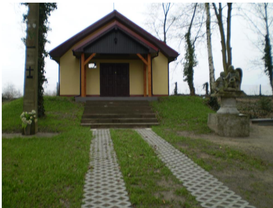
Kaplica cmentarna w Lisim Polu

Kaplica na cmentarzu przy drodze do wsi Nawodna – wybudowany w czynie społecznym z inicjatywy Społecznego Komitetu Budowy Kaplicy zorganizowanego w 2005 r. Odwodnienia wymaga teren cmentarza położony w niszy, co sprawia, że podczas ulewnych deszczów i topnienia śniegu groby znajdują się pod wodą.