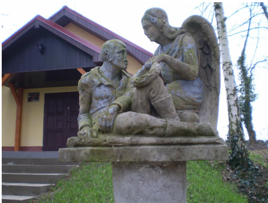
Pomnik poświęcony żołnierzom I wojny światowej w Lisim Polu

Na cmentarzu komunalnym położonym na zachodnim krańcu wsi znajduje się pomnik poległych na I wojnie światowej, który przedstawia anioła pochylonego nad rannym żołnierzem. W ostatnich dwóch latach mieszkańcy wybudowali kaplicę cmentarną, wcześniej ogrodzono teren i doprowadzono wodę.