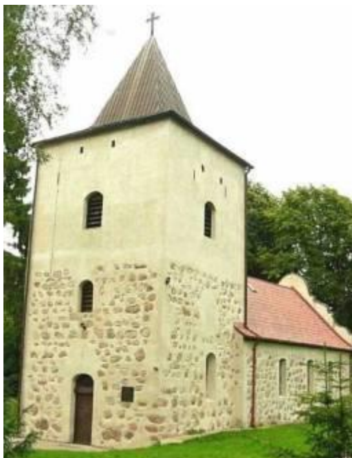
wygląd aktualny kościoła