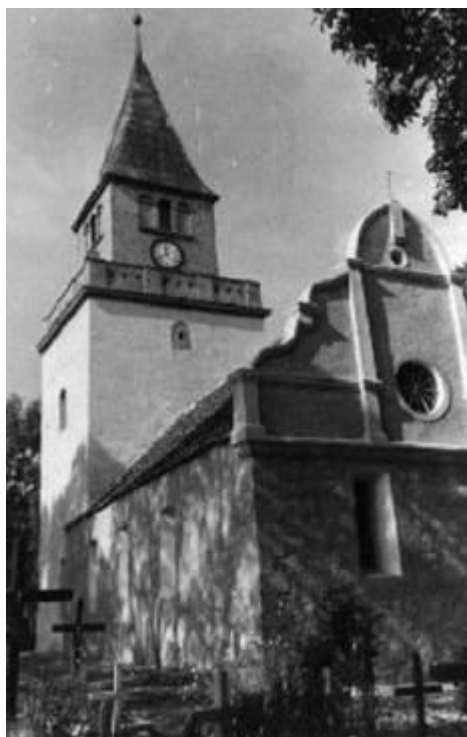
wygląd pierwotny kościoła

Zadanie będzie wykonywane w dwóch etapach: