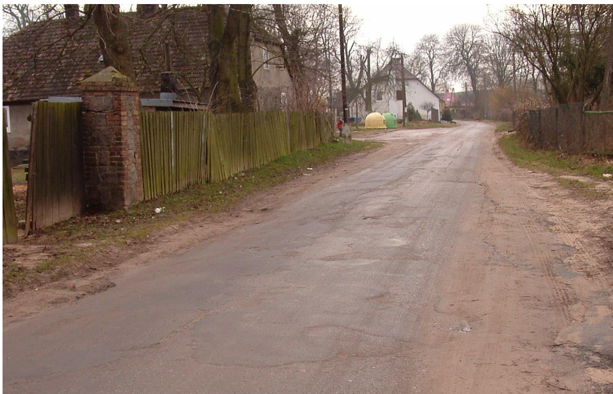
Widok na główną ulicę we wsi

Realizacja inwestycji przewiduje budowę jednostronnego chodnika lub budowy utwardzenia poboczy wzdłuż drogi powiatowej przebiegającej przez miejscowość Krajnik Górny, na odcinku o długości około 500 metrów.