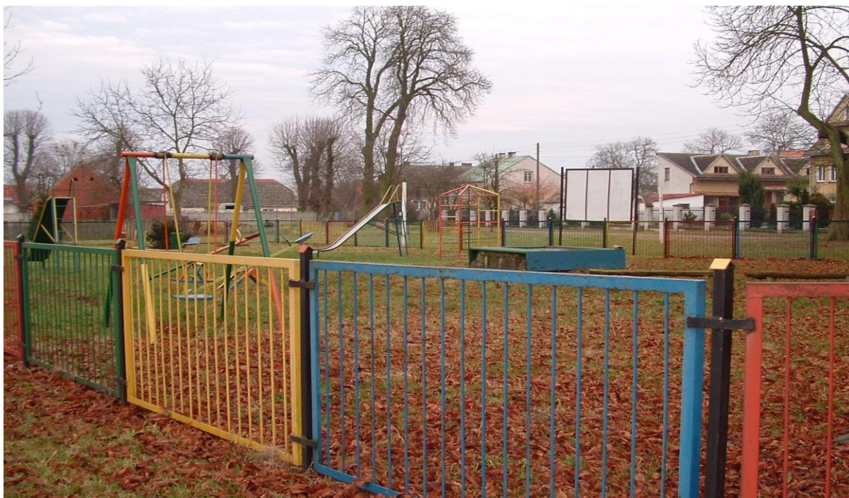
Plac zabaw w Krajniku Górnym

Modernizacja placu zabaw dla najmłodszych mieszkańców miejscowości ma na celu zapewnienie przyjemnego i bezpiecznego spędzenia czasu wolnego przez dzieci i młodzież. Zagospodarowanie terenu zabaw urządzeniami dostosowanymi do wieku i możliwości rozwojowych dziecka w naturalny sposób stwarza dobre warunki dorosłym do sprawowania opieki nad bawiącym się dzieckiem. Nastąpi poprawa bezpieczeństwa dzieci podczas zabaw oraz poprawa stanu istniejącej infrastruktury społecznej we wsi, nowe urządzenia na placu zabaw poprawią estetykę miejscowości. Plac będzie pełnił także funkcję centrum miejscowości, miejsca spotkań i wypoczynku mieszkańców wsi.