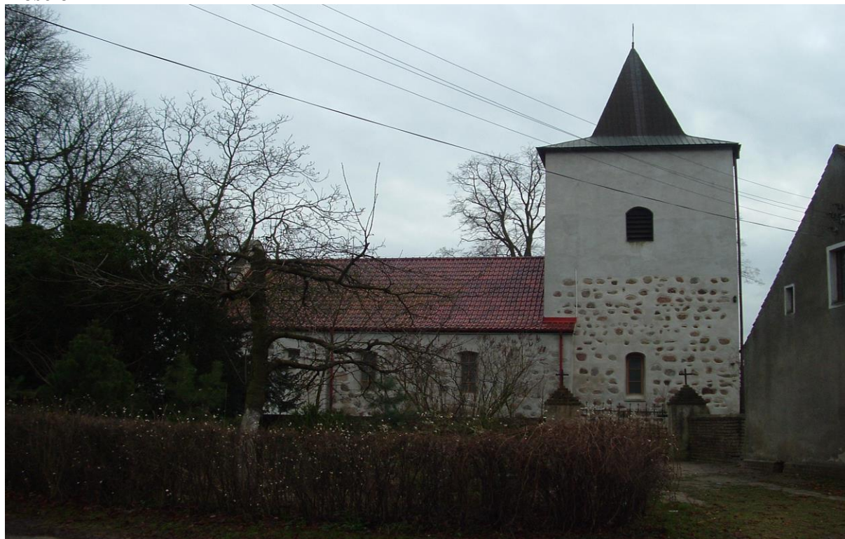
Kościół w Krajniku Górnym

Kościół leżący na terenie Parafii Rzymsko-Katolickiej pod wezwaniem św. Andrzeja Boboli na działce nr 103 o powierzchni 0,17 ha został zbudowany w XV w. z kamienia