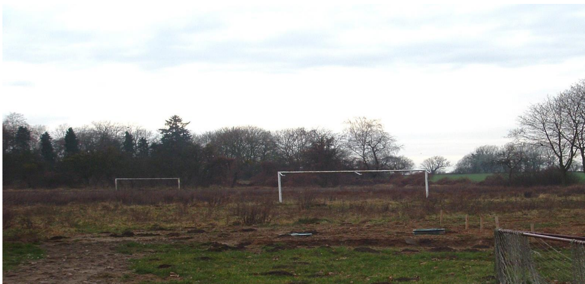
Boisko sportowe w Krajniku Górnym

We wsi znajduje się także boisko sportowe (działka nr 43 o powierzchni 1,65 ha, obręb Krajnik Górny), lecz wymaga ono modernizacji. Przyczyni się to do poprawy dostępności do bazy sportowej, da szansę na stworzenie komfortowego zaplecza dla mieszkańców chcących aktywnie spędzać wolny czas uprawiając sport, pozwoli propagować zdrowy model życia tak wśród dzieci i młodzieży, jak i dorosłych mieszkańców wsi.