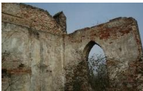
Widok ruin kościoła od środka