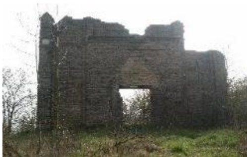
Widok ogólny ruin kościoła od strony Odry

Ruiny Kościoła w Krajniku Dolnym przedstawiają poniższe zdjęcia.