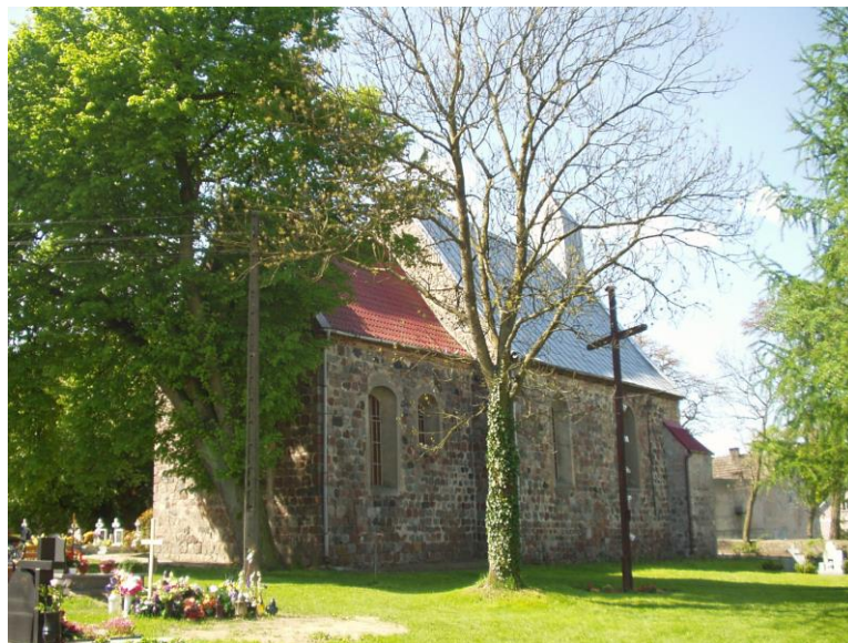
Rys. 2 Kościół w Grzybnie z XIII w.

Kościół - filia parafii w Baniewicach. Kościół zbudowany w XIII wieku. z kostki granitowej; budowa salowa z wyodrębnionym prezbiterium (na planie czworoboku); przebudowany na początku XVIII w. (wówczas postawiono wieżę w konstrukcji ryglowej). Odremontowany w 1946 r., obecnie pełni funkcję sakralną (kościół parafialny rzymsko-katolicki).