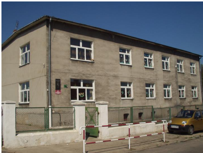
Rys. 3 Szkoła Podstawowa im. Marii Konopnickiej w Grzybnie