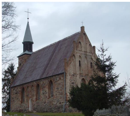
Fot. 1 Kościół w Garnowie