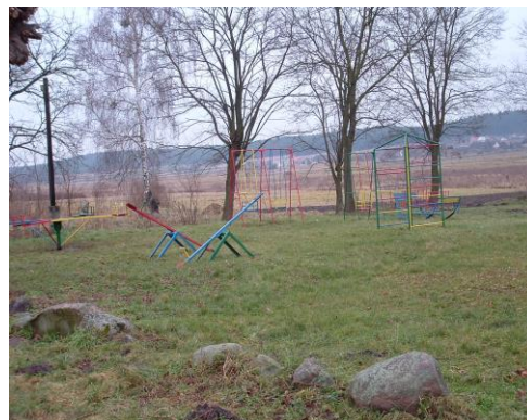
Fot. 2 Plac zabaw – stan obecny