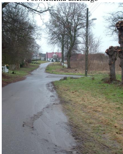
Fot. 5 Obecny stan infrastruktury drogowej i oświetlenia ulicznego