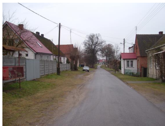
Fot. 6 Obecny stan infrastruktury drogowej i oświetlenia ulicznego