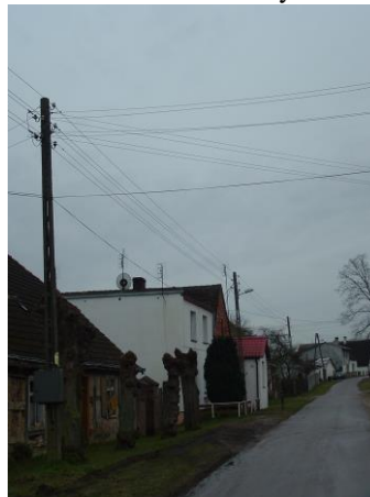
Fot. 4 Obecny stan infrastruktury drogowej i oświetlenia ulicznego