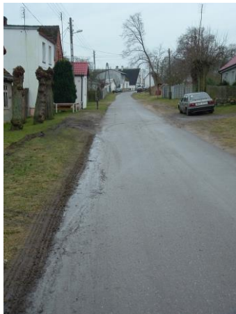
Fot. 3 Obecny stan infrastruktury drogowej i oświetlenia ulicznego