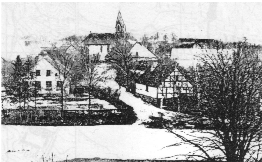
Rys. 1 Wieś Czarторыja – widok od strony północnej (stan z l. 30-tych XX w.)