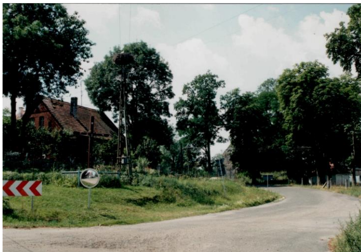
Rys. 1 Widok na środek wsi, z lewej bud. dawnej szkoły (ob. budynek mieszkalny) w głębi kościół.