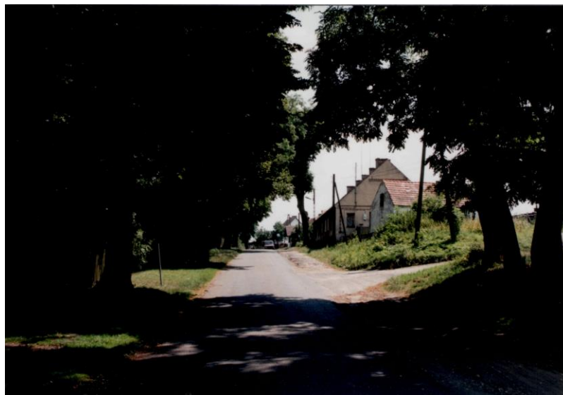
Rys. 2. Ulica w północnej części wsi

Współczesny - zachowane rozplanowanie wsi wg stanu z końca XIX w. Na wyniesieniu przy placu postawiono w centrum wsi pawilon handlowy.