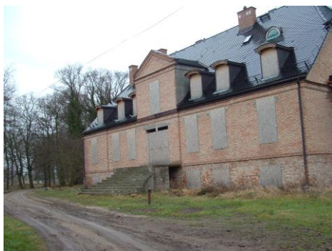
Dwór w Rurce- stan obecny