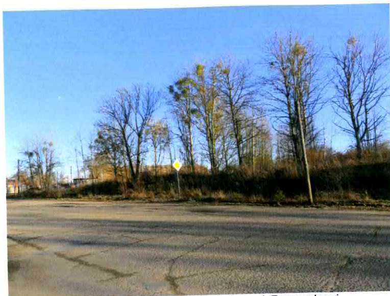
Fot. 1. Nieruchomość, widok od strony ul. Przemysłowej.