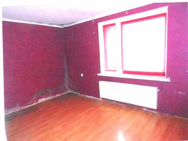
Fot. 2. Lokal mieszkalny, pokój.