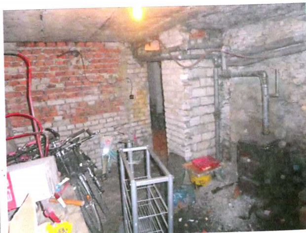
Fot. 6. Piwnica przynależna do lokalu mieszkalnego.