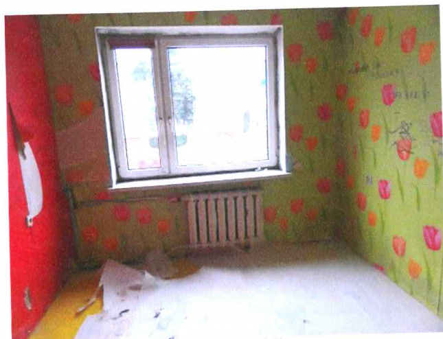
Fot. 3. Lokal mieszkalny, pokój.