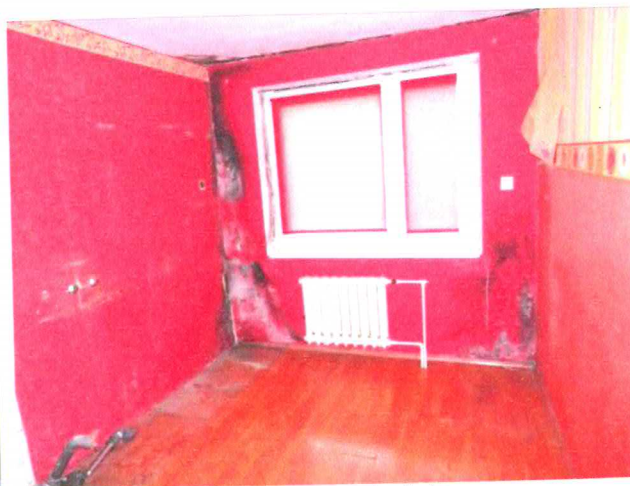
Fot. 4. Lokal mieszkalny, kuchnia.