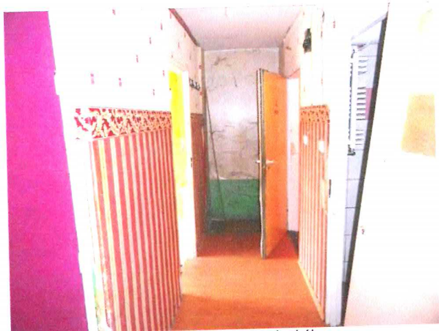
Fot. 1. Lokal mieszkalny, przedpokój.