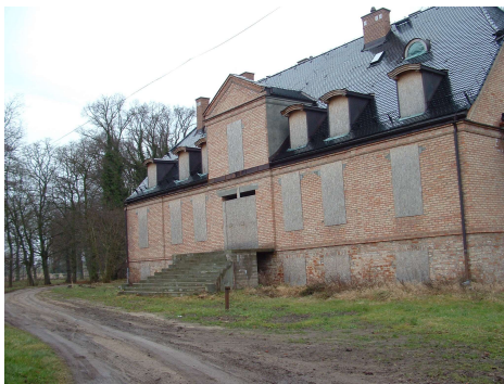
Dwór w Rurce- stan obecny