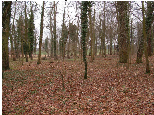
Park dworski – stan obecny

Park dworski. Czas powstania obecnie istniejącego park datuje się na 2 poł. XIX w. Najstarsze drzewa (dęby, lipy i buk) liczą ok. 250-300 lat. Na zachodniej granicy parku posadowiono dwór; na półn-wsch. park dochodzi do brukowej drogi dojazdowej do majątku od strony wsi. Na powierzchni ok. 3 hektarów, na planie zbliżonym do trójkąta, nasadzono głównie drzewa liściaste (wiązy, jesiony, dęby, buki, lipy, kasztanowce) i nieliczne iglaste (świerk serbski, cis) posadzone przy głazie nagrobnym w południowej części parku.