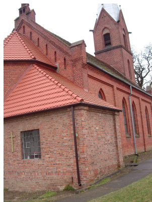
Kościół parafialny w Rurce

Kościół ewangelicki. Kościół ewangelicki - parafialny (z filią w Strzelczynie); świątynia postawiona w 4 ćw. XIX w.; neogotycka ceglana budowla z wieżą i absydą. Wg danych z 1868 r. do parafii należało gospodarstwo z 216 morgami.