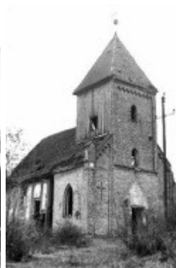
Wygląd kościoła z 1945r.