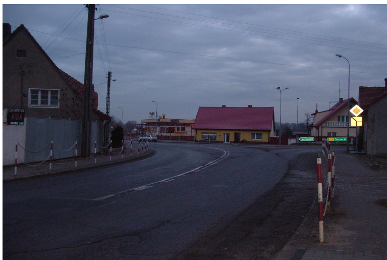
Fot. Krajnik Dolny.

Krajnik Dolny ma położenie przygraniczne, co ma wpływ na natężenie ruchu samochodowego.