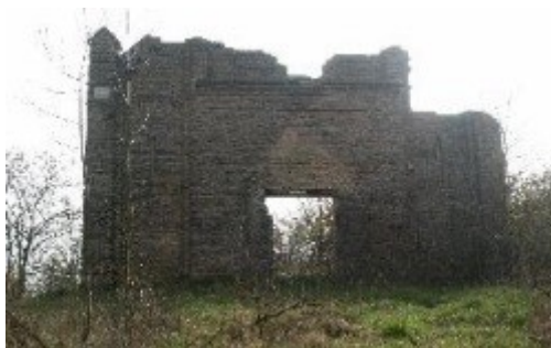
Widok ogólny ruin kościoła od strony Odry

Ruiny Kościoła w Krajniku Dolnym przedstawiają poniższe zdjęcia.