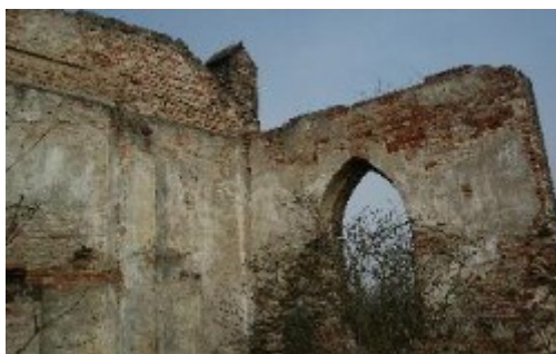
Widok ruin kościoła od środka