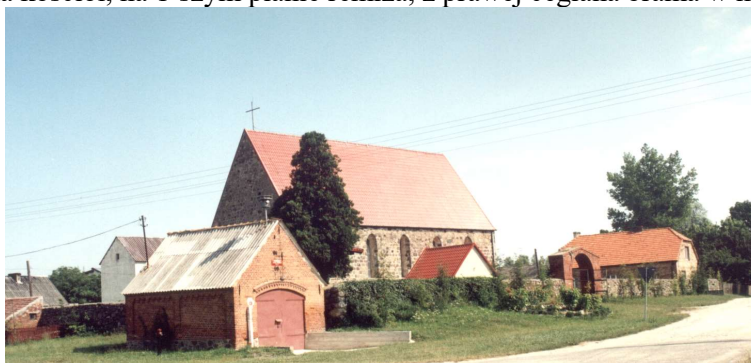
Rys. 2 Widok na kościół, na 1-szym planie remiza, z prawej ceglana brama w murze kościelnym