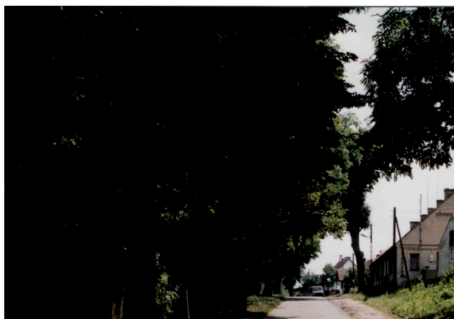
Rys. 2. Ulica w północnej części wsi

Współczesny - zachowane rozplanowanie wsi wg stanu z końca XIX w. Na wyniesieniu przy placu postawiono w centrum wsi pawilon handlowy.