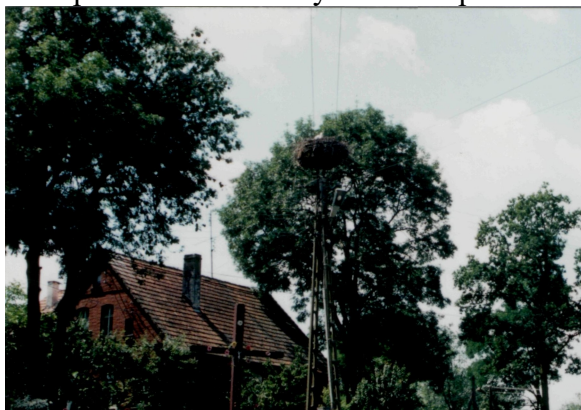
Rys. 1 Widok na środek wsi, z lewej bud. dawniej szkoły (ob. budynek mieszkalny) w głębi kościół.

Kościół - pierwsza wzmianka z 1337 r. dotycząca uposażenia parafii rzymsko-katolickiej (4 łany parafialne); w 1693 r. parafia przeniesiona do Goszkowa; w 1800 r. - filia parafii ewangelickiej w Goszkowie. Świątynia wzniesiona została w XIII/XIV w. z granitowej kostki, w 1840 r. (data na wiatrowskazie) przebudowana; od lat 20-tych XX w. nie pełni funkcji sakralnej - urządzono w nim spichlerz folwarczny. Obecnie przekazany na cele sakralne.